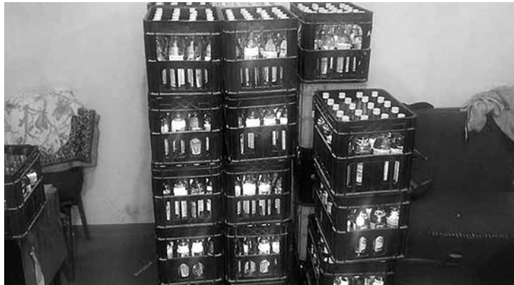
Фальсификат в Мелитополе производят массово