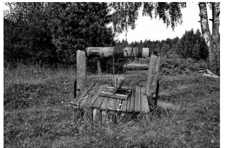
Колодец в селе - единственная возможность выжить в условиях водного террора

Отметим, что это не первый случай, когда за долги Бердянска отключаются жители сел и городов региона. Так, 30 мая Днепропрорудное в который раз пострадал от избирательного подхода со стороны «Запорожьеоблэнерго» к жителям области и самостоятельно принял решение об отключении насосной станции Таврического цеха от электроснабжения. Из-за этого подача воды