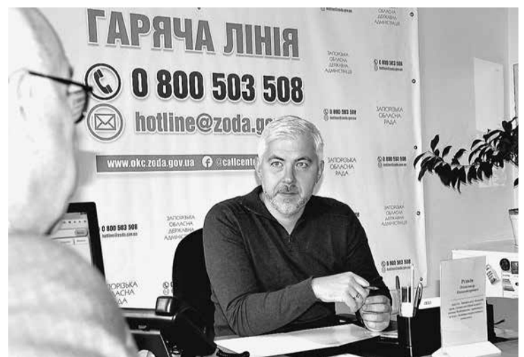
Конструктивный диалог состоялся