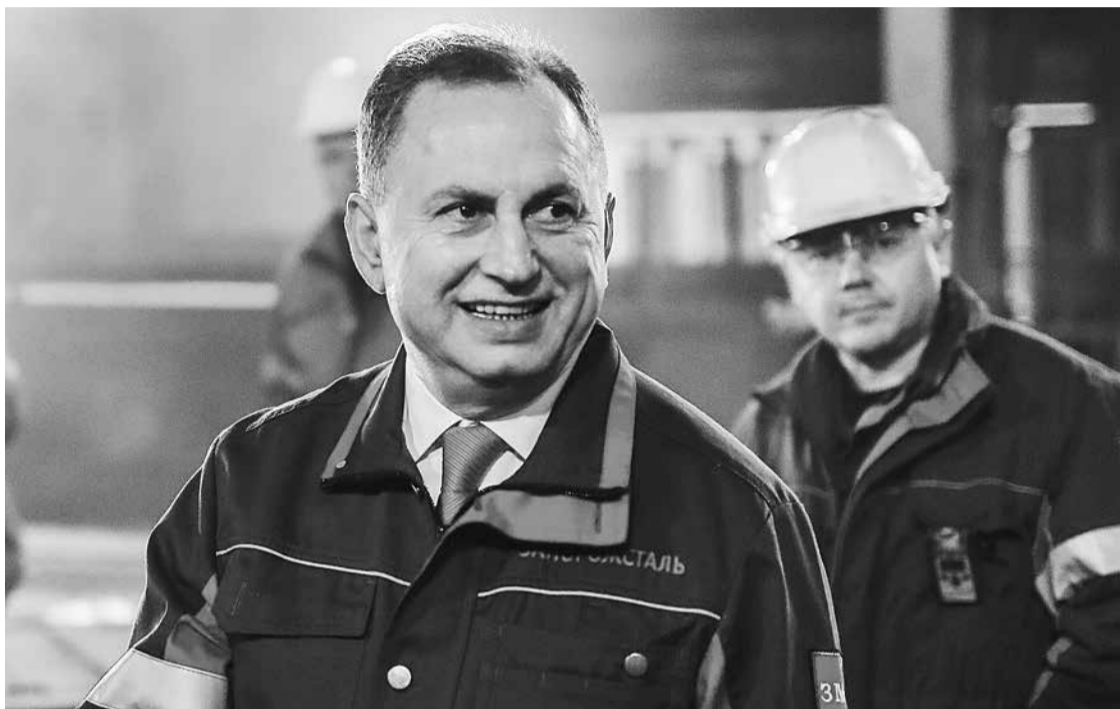
Борис Колесников подчеркнул, что запорожские металлурги со своими обязанностями справляются

– Украина – единственная в мире страна, где надо не лоббировать новые законы, а хотя бы выполнять те, что уже приняты. Экономический рост Украины невозможен без верховенства права и беспрекословного уважения частной собственности. Нужно доверие инвесторов, – подчеркнул Борис Колесников. – Сегодня мы работаем в 5,5 раза хуже