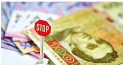
Взносы в школах отменяются