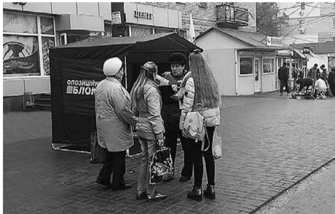
Запорожцы против антинародных реформ

Всего во время акции под требованиями оппозиционного правительства поставили свои подписи почти 36 тысяч жителей Запорожской области.