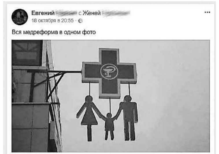
Украинцы высмеивают реформу в соцсетях

своей странице в соцсети она предупредила граждан о том, что их ждет очень «веселая» жизнь, и поделилась ориентировочными расценками на медицинские услуги: «Хто виживе? Надаю окремі скани попередніх розрахунків цін за медичні послуги з різних медичних закладів. Можливо, ви зрозумієте, чому МОЗ досі офіційно не затвердив модель розрахунку медичної послуги, не оприлюднив ціни на медичні послуги і не надав перелік того, за що після «реформи» держава вже платити не буде».