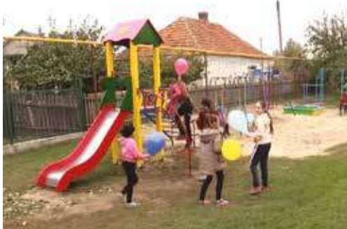
Депутаты объединились ради детей