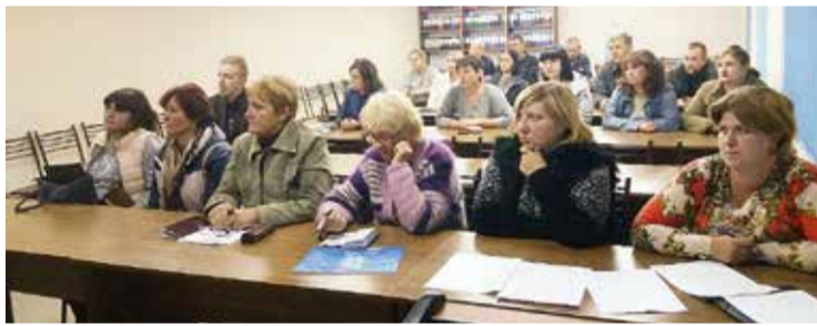
ОБ представил своих кандидатов в депутаты ОТГ

Мелитопольская районная организация Оппозиционного блока выдвинула 15 кандидатов в депутаты Новобогдановского сельского совета на выборах в объединенной территориальной громаде. Более половины претендентов на кандидатский мандат – женщины, настоящие Берегини родной земли