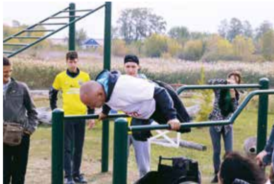
Новый парк объединил людей

В этноселе Геленджик благодаря проекту социальных инициатив ПАО «Запорожсталь» «Мы – это город» появилась новая тренажерная площадка для людей с особыми потребностями. Назвали ее – «Парк единения». Авторы проекта получили на воплощение своей идеи грант в размере 80 тысяч гривен