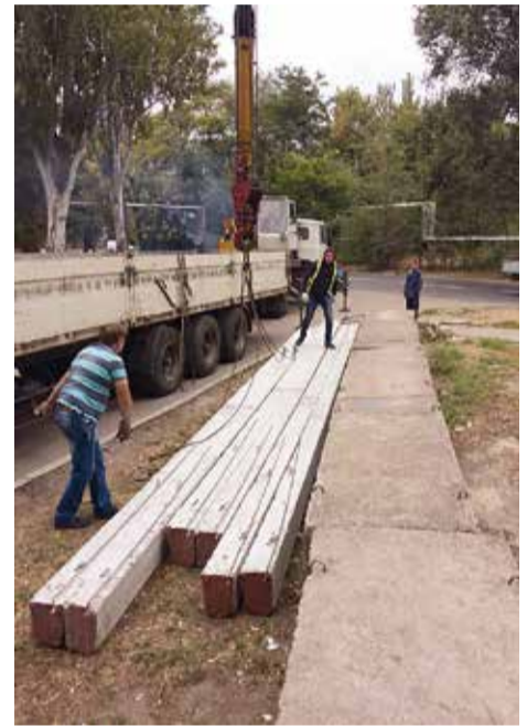
Ход работ – всегда под контролем

Отметим, что Константин Нагих также контролирует ход ремонта в домах №№ 76, 77 по улице Военстрой.