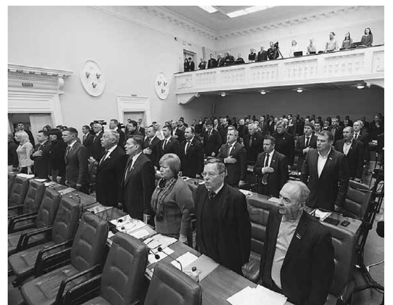
Депутаты горсовета защитили горожан от лишних трат