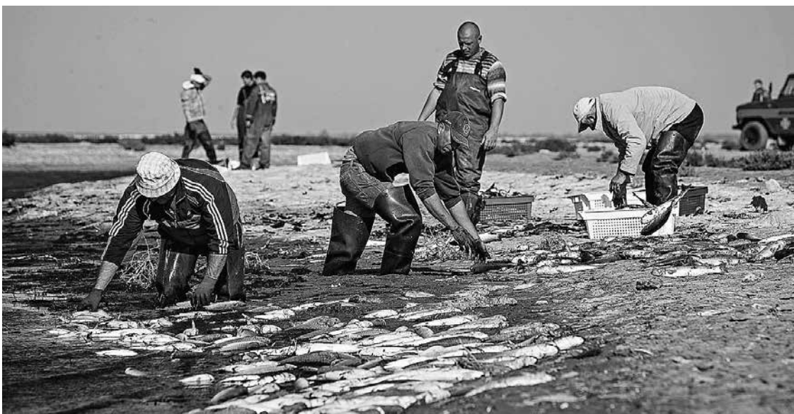
Дохлую рыбу собирали несколько дней