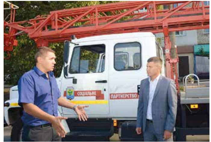
На улицах города стало тепло и безопасно

Городская власть совместно с депутатом областного совета от Оппозиционного блока Владимиром Усатым закупили современные LED-светильники и уже начали установку их на улицах города