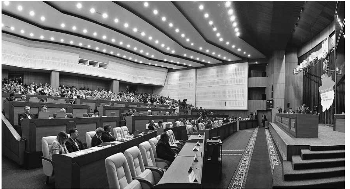
Попытки «демократов» сорвать сессию облсовета провалились