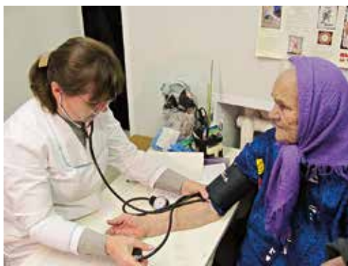
Помощь не только врачам, но и жителям райцентра

В связи с рядом новшеств в украинском законодательстве, не все органы местного самоуправления способны самостоятельно содержать свои коммунальные учреждения. В частности, с такой проблемой столкнулись в Бильмакском районе. Центральная районная больница, которая всегда финансировалась из районного бюджета, сегодня находится на грани частичного закрытия