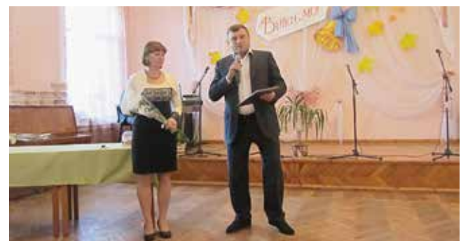
Низкий поклон всем учителям