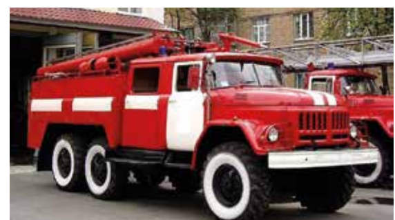
Безопасность во время отопительного сезона будет обеспечена!